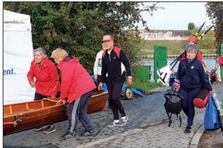
Wanderruderer aus Nah und Fern

Heute ist alles viel entspannter, die Schleusen sind leicht zu befahren, nur die Schifffahrt sucht sich dominant den Weg, aber dann über die Spree und Treptow und Bitzer Zweigkanal zum Wiking ist schon spannend zu erleben. Für viele Ruderer aus allen Bundesländern eine hoch interessante Fahrt, insbesondere wenn man dann den 30-jährigen Geburtstag des Mauerfalls feiern kann, da gibt es viel zu erzählen. Eng wird es nur vorm Wiking. Rennrudern trifft auf Wanderrudern. Organisation, Verkehrslenkung ist angesagt, aber alles funktioniert, auch wenn Alti in seiner traditionellen Ruderkleidung noch mehr graue Haare bekommen hat, aber alles in Würde mit Gelassenheit meistert.