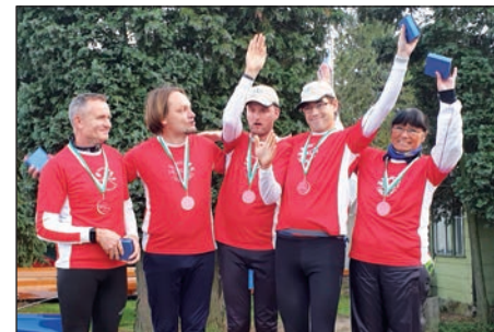
BRC Hevella, Sieger im Inklusions 4-er