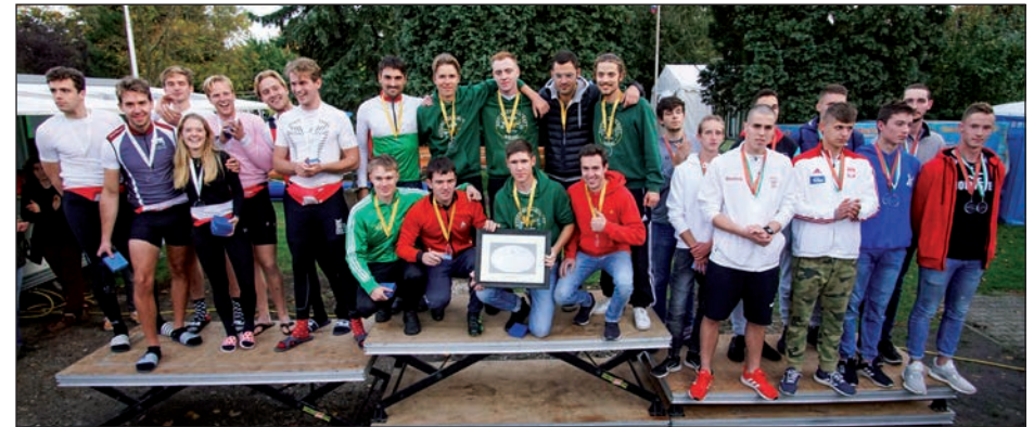
Siegerehrung „Silberner Riemen von Berlin“, li. Skol Amsterdam, mi. RG Wiking, re. Lotto Bydgoszcz

Herzlichen Glückwunsch, allen konnte man die Anstrengung der spannenden, teils knappen Rennen ansehen.