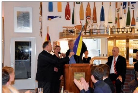
Eng Freundschaft mit der Ukraine, Malaya Flotilya Kiev