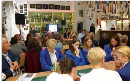
Festlich gekleidete Aktive aus Bydgoszcz

Nachdem 2018 sich der Wiking 8er in die Siegerliste – Silberner Riemen 2018 Männer – eintragen konnte, gelang ihm mit der Langstrecke über 6,3 km, dem Zielsprint über 250 m und sieben von acht Siegen in den Preissprints erneut der Sieg im Jahr 2019 vor Skoll Amsterdam und RTW Lotto Bydgoscia Bydgoszcz.