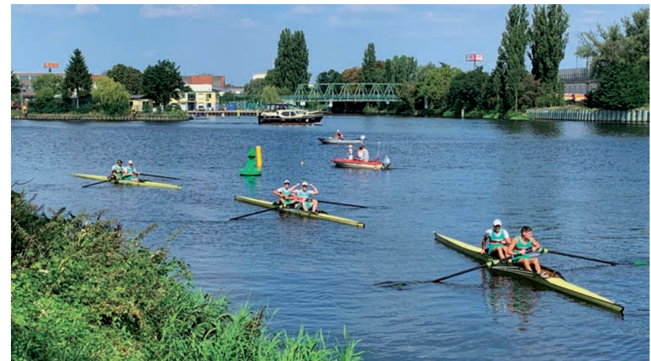
spannender Sport vor dem Bootshaus

Bei sommerlichen Temperaturen von fast 30 Grad fand am Samstag, den 24.08.19, die 66. Neuköllner Ruderregatta statt. Am Britzer Hafen suchten die RG Wiking und der NRCB ihre Besten über die Sprintdistanz von 250m.