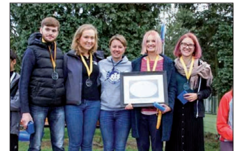
AZS AWF Krakow, Gewinner des „Silbernen Riemen von Berlin“ im 4x-W

Ein besonderes Highlight war die Taufe des 1er auf den Namen Sköll durch den extra aus Amsterdam angereisten Vorsitzenden Wesley van Breda. Wesley wies auf die besondere Beziehung zwischen den Vereinen Sköll und RG Wiking hin, die der Anlass für die Taufe des 1-er ist.