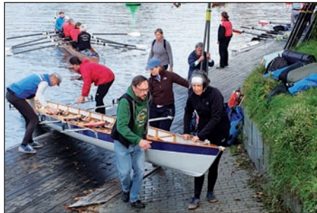
nach dem rudern die die Rampe rauf!

Ein Glück, dass wir die großen Wiese unserer Nachbarschule für Renn- und Wanderruderboote sowie zur Übernachtung nutzen dürfen.