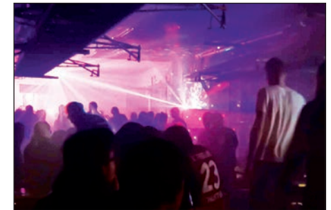
after Row Party, alles im magischen Licht

Schon im letzten Jahr konnte das Festival um die – After Row Party – erweitert werden. Eine Party, die zunächst heiß und intensiv diskutiert wurde, aber wer trainiert, rudert, kann auch feiern und das mit vollstem Vertrauen.