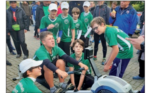
lautstarke Anfeuerung der Wiking Kids