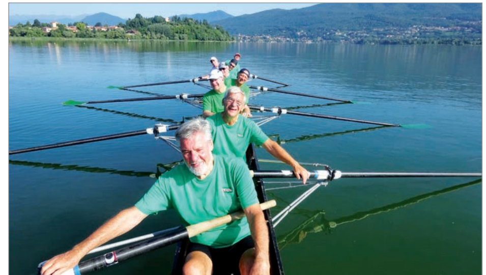
der Masters 8er auf dem Lago di Varese