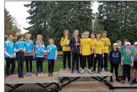
Siegerehrung Kids-Cup, mi. Wannseelöwe, li. NRCB und re. RG Wiking