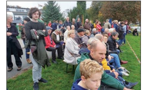
Zuschauer an der Regattastrecke, begeistert von den Sprintrennen

Dieser kurze Abriss gibt nicht alle im Hintergrund ablaufenden Aktivitäten wieder, aber hinter jeder steckt mindestens ein/eine begeisterte/r Ruderin/Ruderer/Nichtruderer vom Vorstand bis zur Verwandtschaft, Freunden und Bekannten.