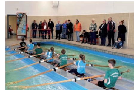
NRCB und RG Wiking in einem Kasten