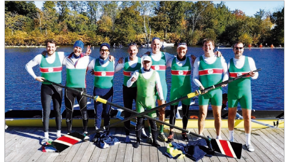
Wiking in Boston Head of the Charles

zu halten. Ausländische Mannschaften, gerade Junioren, werden hier auch privat untergebracht. Viele Familien nehmen Gäste auf, die Ruderer-Gemeinschaft wird hier besonders intensiv gelebt. Zudem, alle Wege sind kurz, meist lohnt es kaum U-Bahn zu fahren.