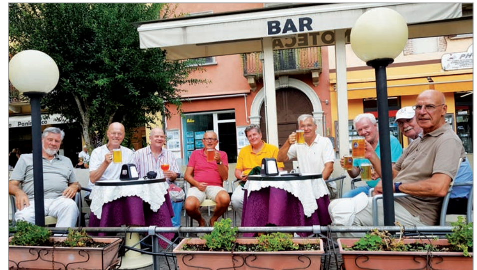
Bella Italia in flüssiger Form

Selbstverständlich machten wir auch den ein oder anderen Ausflug in die Umgebung. Der Lago Maggiore liegt keine 20 km entfernt und die darin befindlichen, sehr schön anzusehenden Borromäischen Inseln waren eines unserer Ziele. Und nicht zu vergessen erfreuten wir uns auch an den kulinarischen Genüssen, die Bella Italia in flüssiger als auch in fester Form zu bieten hat.