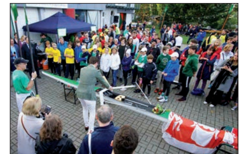
Taufe des 1er auf den Namen Sköll