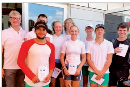
Kooperation im 8er