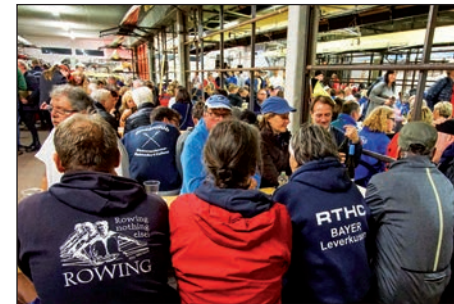
Stimmung in der Bootshalle

sind schon wieder fit um den Wiking gen Heimat gegen Mittag zu verlassen.